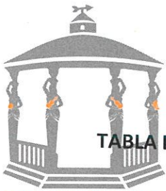
TABLA ESTADÍSTICA DE LA TERCERA SESIÓN DEL PRESENTE AÑO DE LA COMISIÓN EDILICIA DE IMAGEN URBANA-